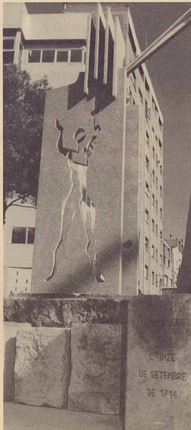
Monument a l'Onze de Setembre

màtica de control de contaminació atmosfèrica al c/ Joan Vinyoli