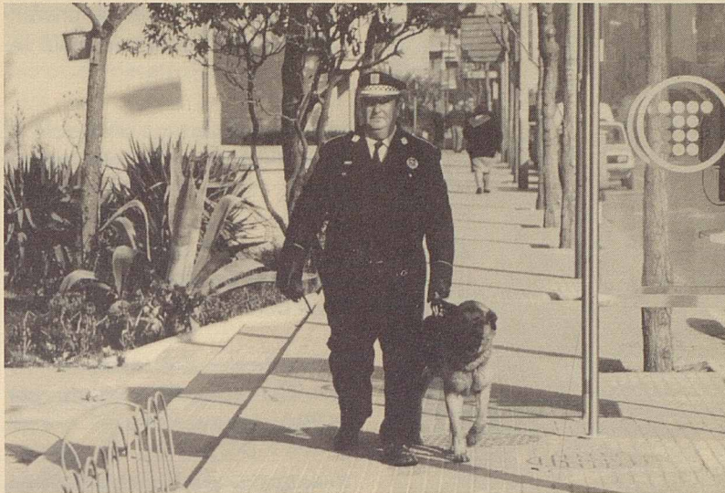
Servei als barris amb gossos policia