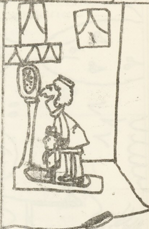
- Ciento cuarenta kilos. Ahora lo dividimos por dos y sabemos lo que pesamos cada uno.