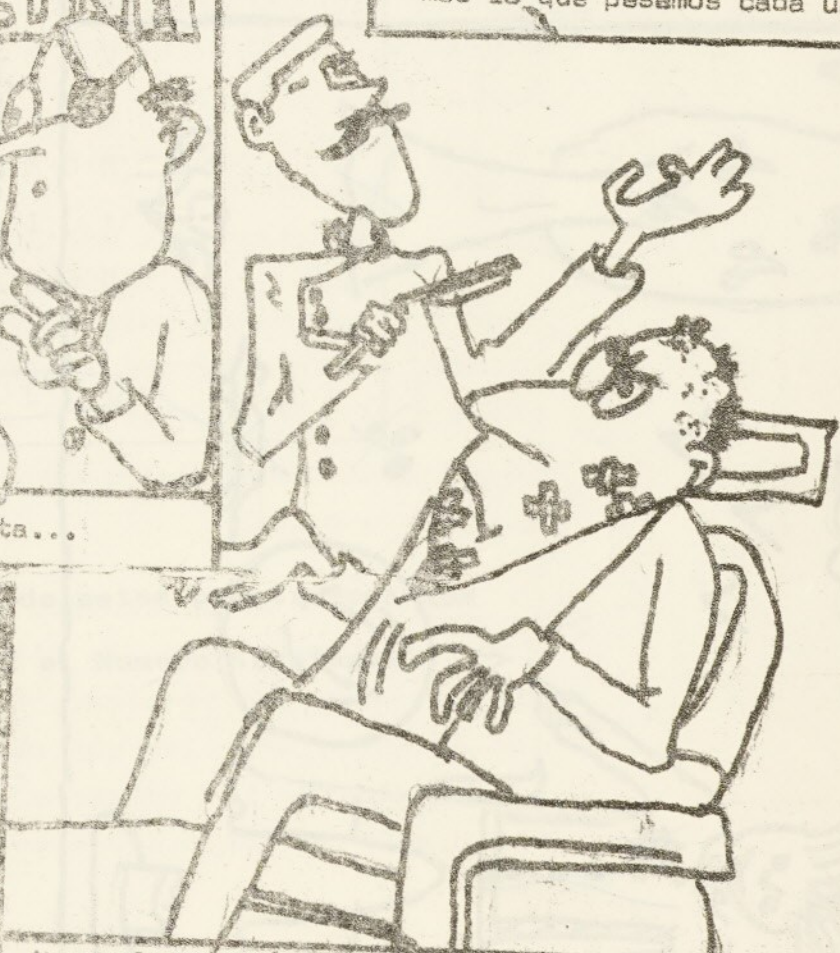
-No se lo creerá, pero este es mi segundo día en el oficio...