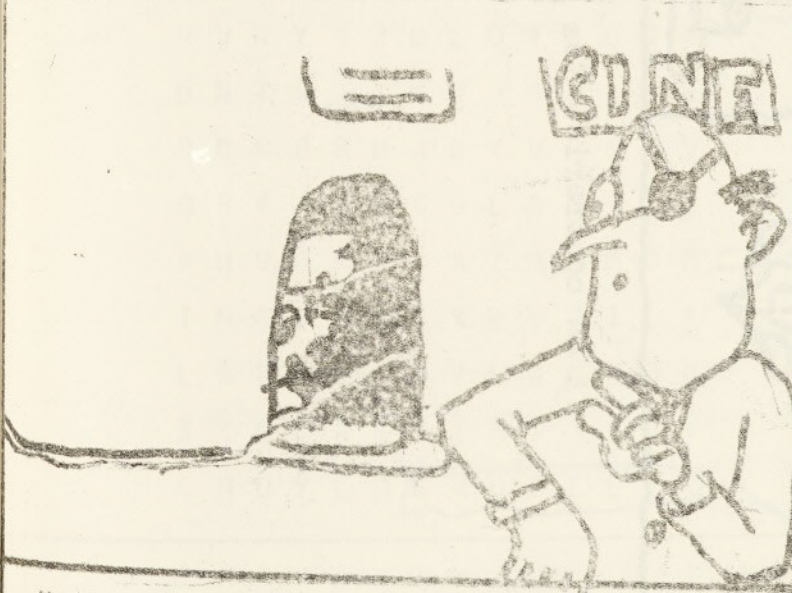
- Media entrada, por favor, señorita...