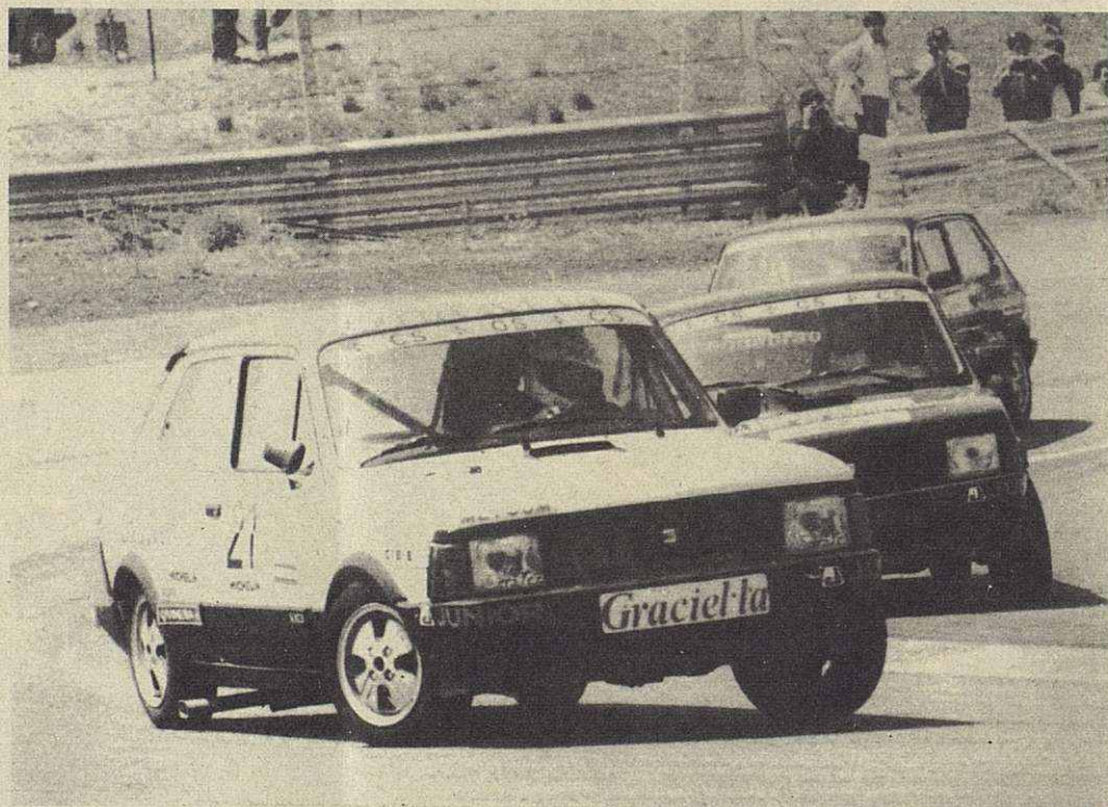
En primer término, el coche de M a Carmen, en dura pugna con otros pilotos a la salida de una curva en el circuito del Jarama, durante una prueba correspondiente al campeonato de España «Copa Fura».

La entrevista fue corta y no dió para más. Nuestro deseo era recoger unas palabras de la campeona, a la que deseamos mucha suerte en esta neva temporada.