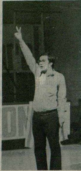
LA PARAULA, EL GEST I LA LLAVOR