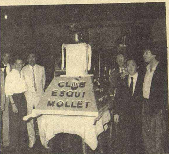
Festa cloenda de temporada (presència de Blanca Paquito Fernández Ochoa)