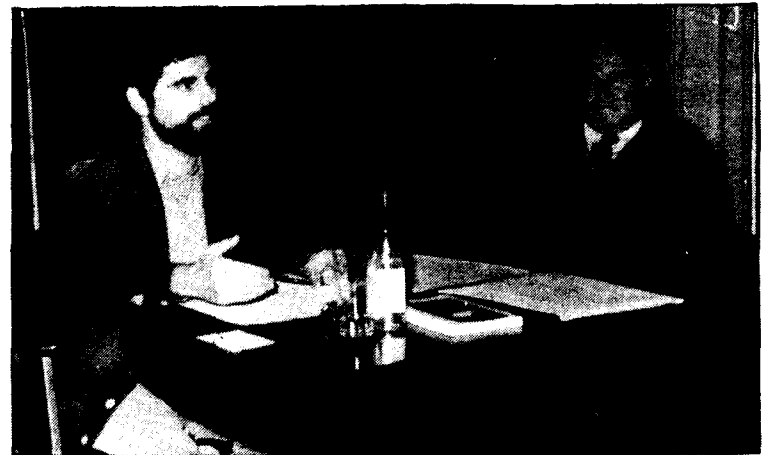
Els autors del llibre

En el transcurs de l'acte de presentació els autors explicaren el contingut de cadascun dels capítols i varen fer un resum del que serà aquest llibre que, per altra banda, es publicarà probablement per Sant Jordi. La presentació anava acompanyada d'una exposició de fotografies, mapes topogràfics i dibuixos arquitectònics que estaran també inclosos en el llibre.