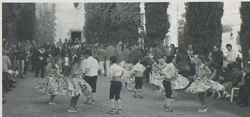
Actuació de la colla dels mitjans de les gitanes de Santa Eulàlia.

ze sacerdots de les parròquies de l'entorn i d'altres que tenen forta vinculació amb Puiggraciós, que no van voler deixar passar l'oportunitat de participar en la commemoració. Malgrat ser dia laborable, l'església altra vegada va quedar petita.