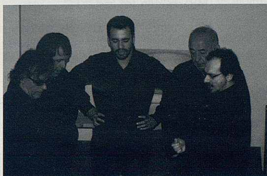
Concert del grup musical la Nova Euterpe.