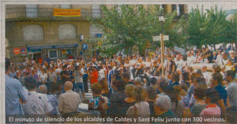
El minuto de silencio de los alcaldes de Caldes y Sant Feliu junto con 300 vecinos.