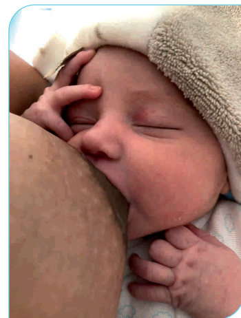
Premi per votació popular