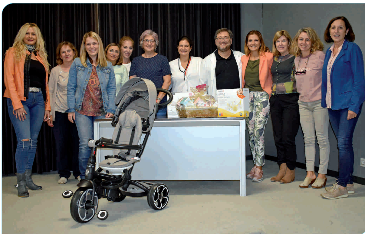
Imatge de totes les premiades en el concurs de fotografia sobre lactància materna que es fa cada any a l'Hospital