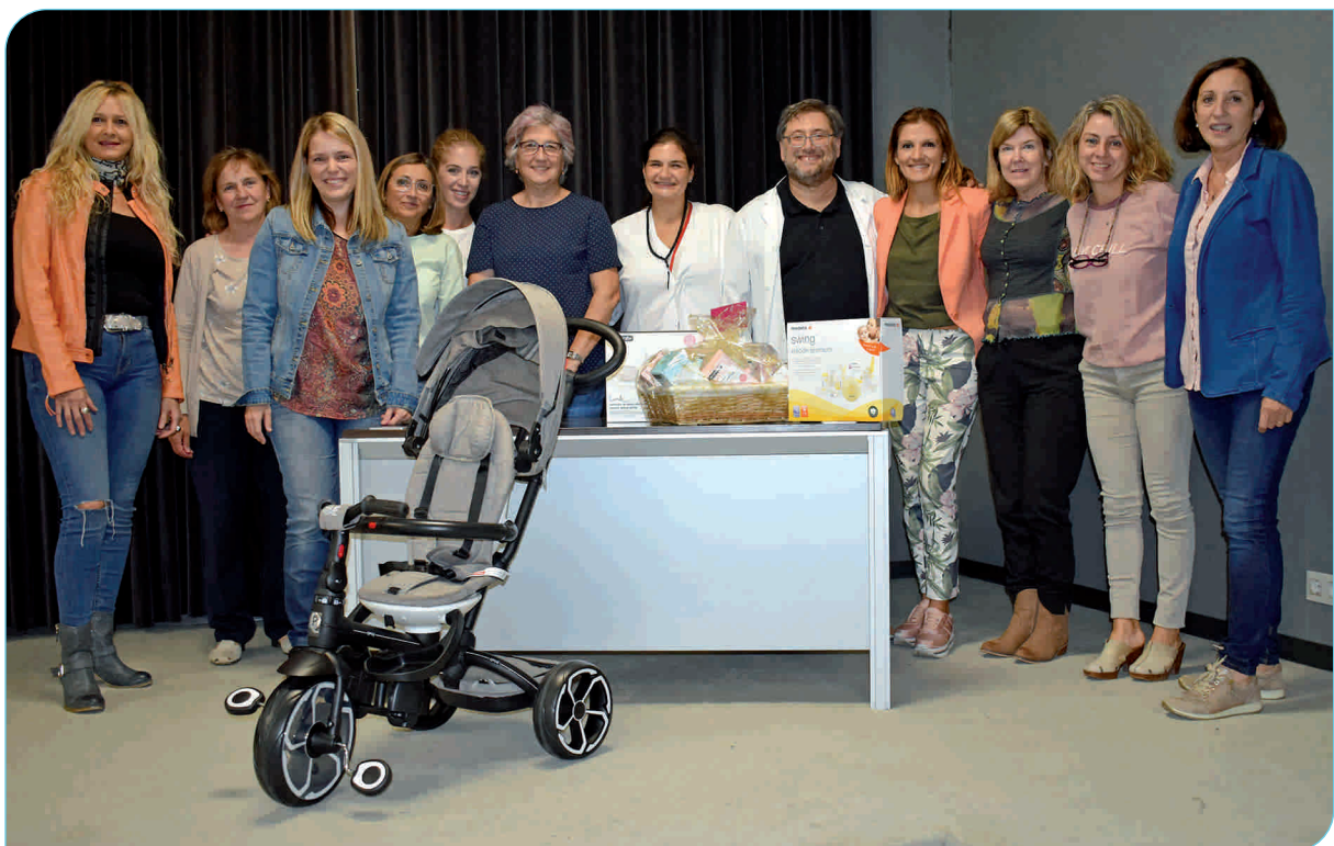
Imatge de totes les premiades en el concurs de fotografia sobre lactància materna que es fa cada any a l'Hospital