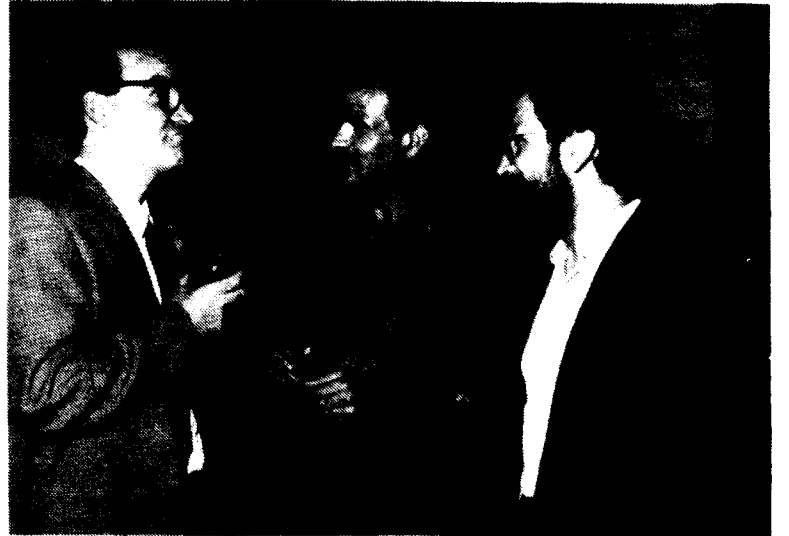
L'alcalde de Granollers i el regidor d'urbanisme amb l'artista