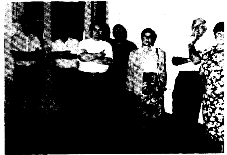
Amics assistents a la inauguració