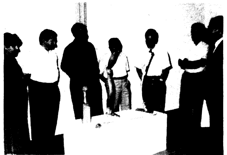
Comenten una escultura anomenada "xut al travesser"