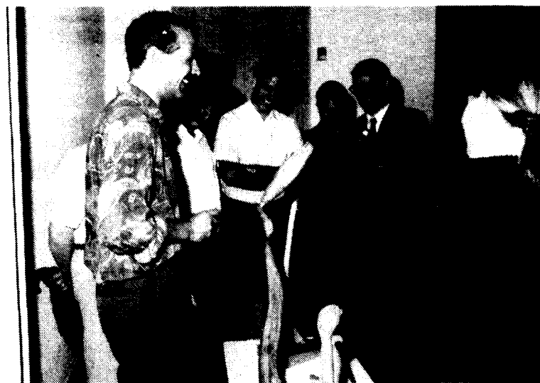
La satisfacció d'una tasca ben feta