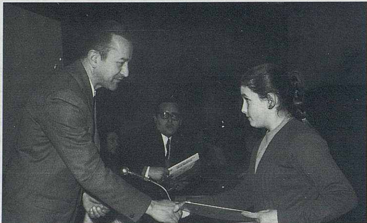
Institut de Granollers. Premi literari. Anys setanta.