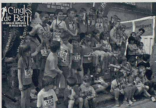
Cursa de Cingles de Bertí. Podi infantil.

Paral·lelament a la cursa es van fer les Mini Trail series per nens i nenes de 3 a 11 anys. Les distàncies variaven en funció de les categories entre 300 metres pels més petits fins els 1500 pels més grans. Va tenir molt bona acollida tant per part dels pares com pels petits corredors, tot i que el tret pirotècnic de sortida va espantar-ne més d'un.