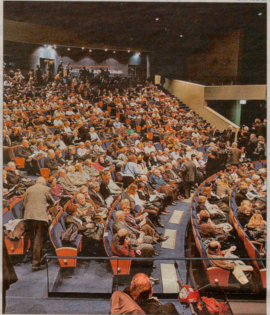
El Teatre Auditori de Granollers entra ja en una nova etapa superats els seus primers 10 anys.

Les valoracions sobre el fet cultural del Teatre Auditori de Granollers no deixen lloc per al dubte: s'ofereix una programació sòlida i prou convincent. Però el Teatre Auditori (inversió cultural, diuen) costa uns quants milers d'euros a la ciutat. Tot és qüestió de prioritats. PM