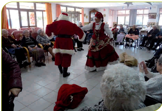
El Pare i la Mare Noel van fer una visita al centre