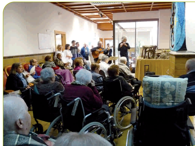
A la residència no hi va faltar la tradicional cantada de nades