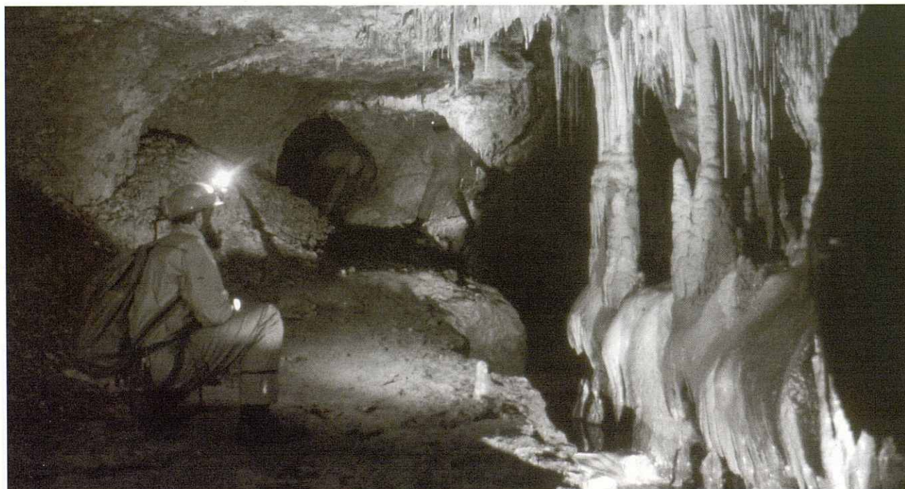
Una de les característiques d'aquesta cavitat és el de tenir racons bellament decorats amb boniques formacions.

pas de sorra, pedres, branques i arrels i per un estret pas aconsegueixen accedir a l'exterior. S'havia acabat de descobrir la boca superior de la cavitat! Estaven molt cansats, era mitjanit d'un rigorós hivern i amb una gelada que queia que ho havia deixat tot blanc. Enfangats, xops de dalt a baix, sense menjar, sense brúixola, sense plànol, sense carbur, tot havia quedat dins la cavitat. On som?? Cap on anem?? Què fem?? ...Quin fred!! Caminaren en direcció nord fins a trobar una carretera, seguien fins a les primeres cases de