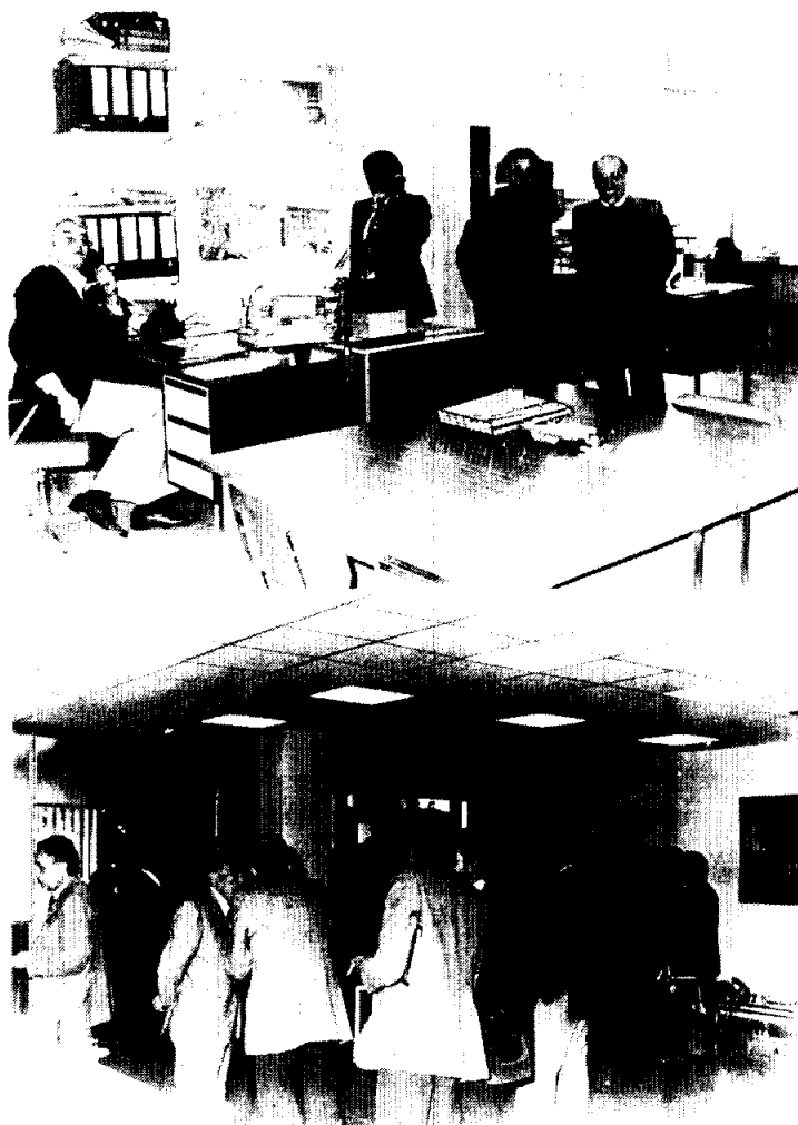
Los momentos de la inauguración de los nuevos locales de FECSA.