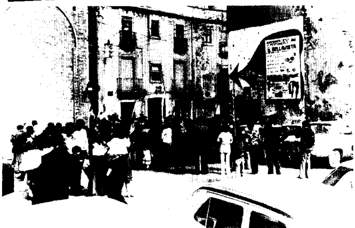
Los instantáneos de la bendición de las palmas en la Iglesia parroquial de Granollers.