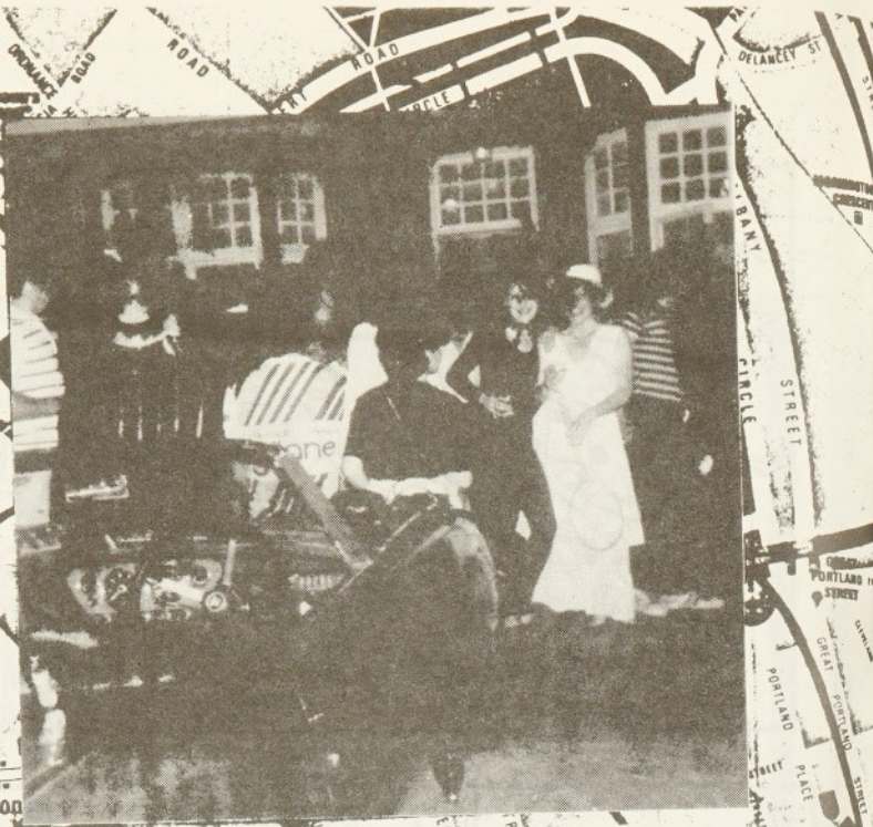
Una mostra carnavalesca ben atípica en el món londinès.

——— GENERAL ——— CIRCLE ——— DISTRICT ——— AREA ——— METROPOLITAN ——— PEACOCK ——— VICTORIA Línia blanca: itinerari de peatge d'express ——— BRITISH R.