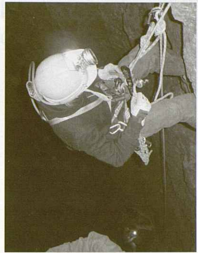
Un cursetista en plena acció, el pas d'un fraccionament en baixada.