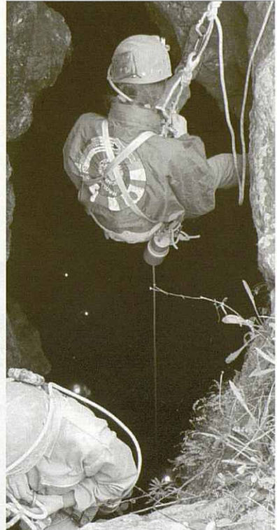
De la sortida de pràctiques a una cova es passa a les sortides de pràctiques en cavitats verticals.

S'intenta sensibilitzar al cursetista a respectar la Natura i protegir el medi ambient.