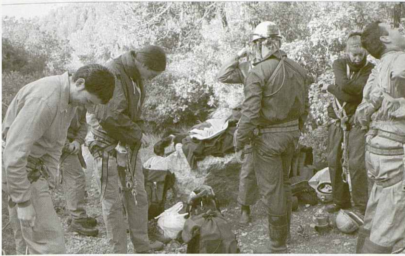
Els participants a la sortida de pràctiques es preparen per iniciar el descens de l'Avenc.