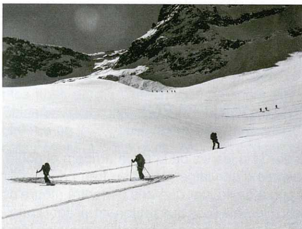
Ascens a Sacklimi de 2.660 m.

S'aixeca un dia fantàstic amb uns 50 cm de neu pols nova. El dia somiat per un esquiador!! Així que ben aviat tot el refugi inicia la seva activitat per gaudir de la neu. Nosaltres ens dirigim al refugi Trift amb un grup nombrós d'alemanys i un