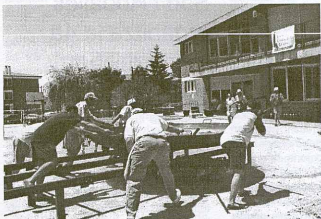
Els membres de l'Associació de Comerciants preparant l'arròs.