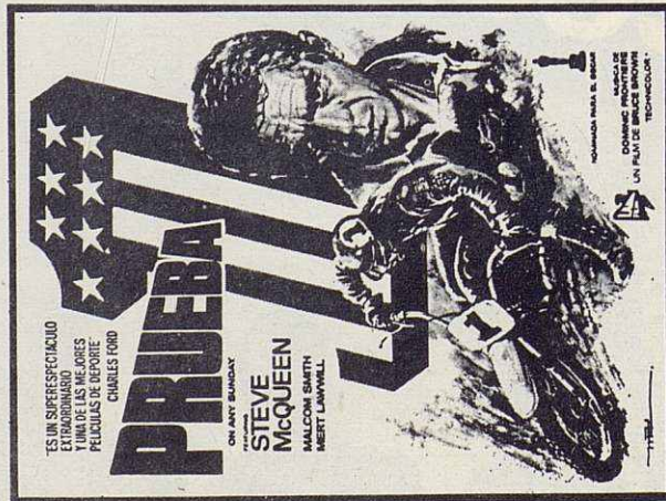
ES UN SUPERESPECTACULO EN CINEMA LAS GRANES PELICULAS DE REPORTE CHARLES FORD

Las sesiones de 8'15 y 10'30 son numeradas