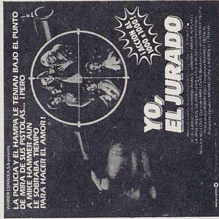
WARRNER COMMUNICATIONS SA presenta YO, EL JURADO LA POLICIA Y EL HAMPA LE TENGAN BAJO EL PUNTO DE MIRADA DE SUS PISTOLAS... ¡PERO EL TIEMPO EN QUE EL TIENEN LE SOBRA. ¡TIEMPO PARA HACER EL AMOR!

Las Sesiones de las 8'15 y 10'30 son numeradas