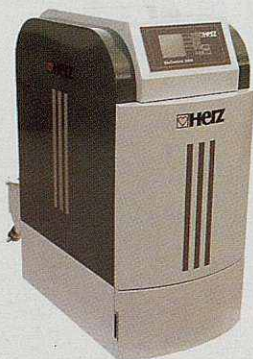
Caldera de biomassa automàtica