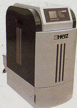
Caldera de biomassa automàtica