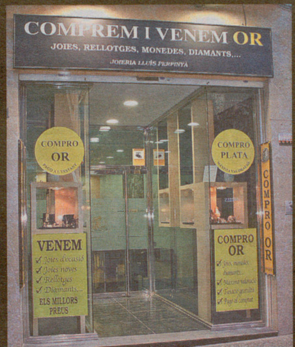
Joieria Lluís Perpinyà