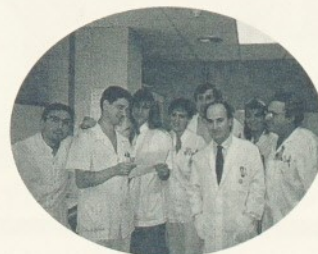
L'equip del Servei de Diagnòstic per Imatge.

Aquest pòster tracta de les variants anatòmiques dels recessos superiors del pericardi en els nens, que poden donar origen a falses