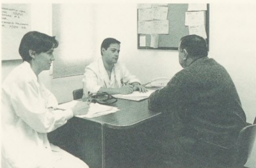
Als tres mesos de la seva posada en marxa podem fer un balanç positiu de la UDD.