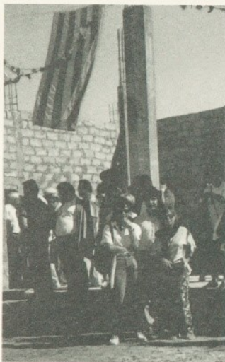
La delegació de l'Hospital de Granollers davant del pavelló maternoinfantil de l'Hospital Bachir Salah.