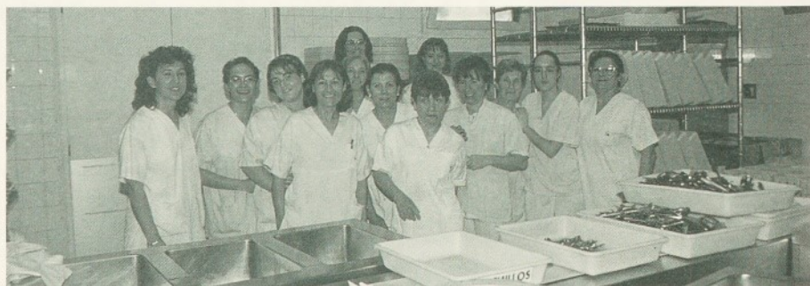
L'equip del servei de Restauració.

som responsables del benestar de cada una de les persones que treballen o han d'estar ingressades a l'Hospital. És per això que hem implantat un pla de neteja