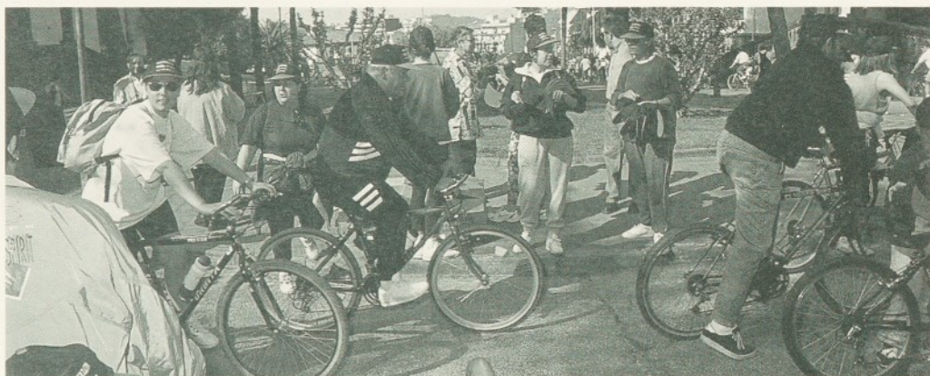
La Diada de la bicicleta va passar per l'Hospital.

Tots dos grups de ball van oferir al públic assistent uns quadres variats i alegres, que van fer les delícies de tothom. Un cop acabat el festival, es va oferir, a la pineda del centre geriàtric, un àpat a base de fino i tapes per a tots els assistents.