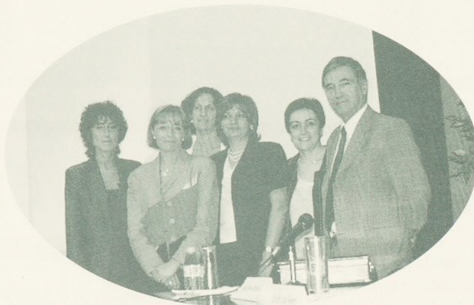
La Jornada va comptar amb la participació de destacats professionals.

El passat 11 de juny va tenir lloc a la sala d'actes del Centre Geriàtric la I Jornada sobre la Prevenció, el Seguiment i el Tractament de les Úlceres, organitzada per l'Institut Català de la Salut (DAP de Granollers) amb la col·laboració de l'Hospital de Granollers. La Jornada va consistir en una