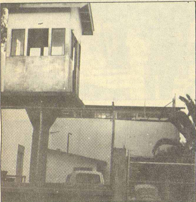
Exteriores de la cárcel de mujeres de Quito.