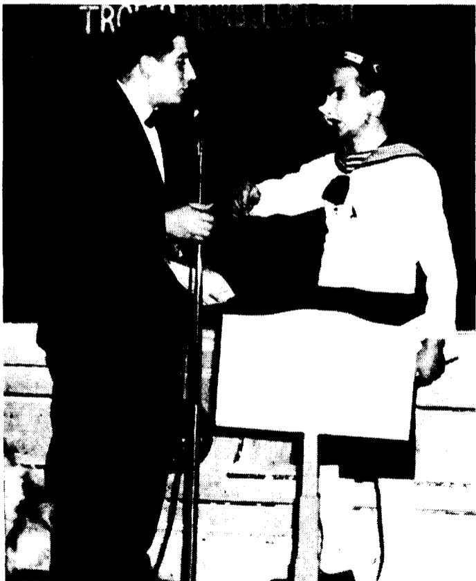
1953 Casino de Granollers Club de Ritme Després de la històrica fusió de les societats es conservà la tradició de dedicar el Carnaval a un esdeveniment cultural i els joves del Foyer's llurarem el trofeu Pedra de l'Encant del premi literari: Cap d'Any.