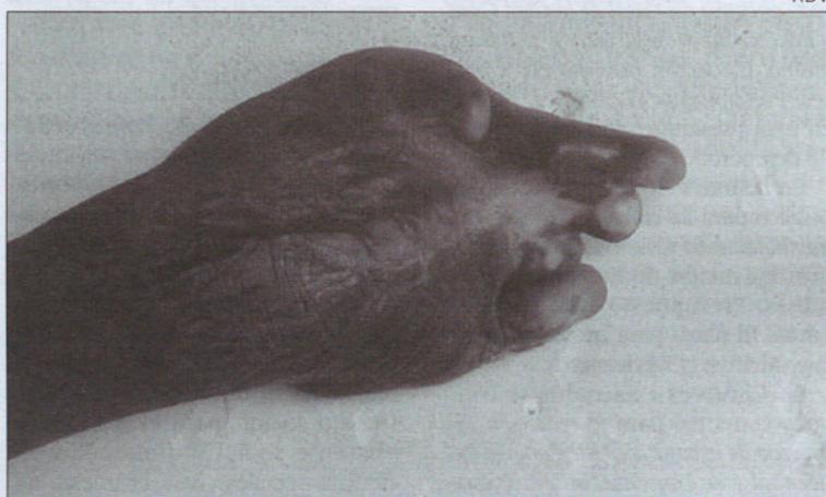
Estado en que quedó la mano izquierda tras el ataque de su padre.

to, que ni tan siquiera pueden diferenciarse los dedos. En este caso, se intentará que parte de la mano recupere su movilidad para poder actuar también a modo de pinza.