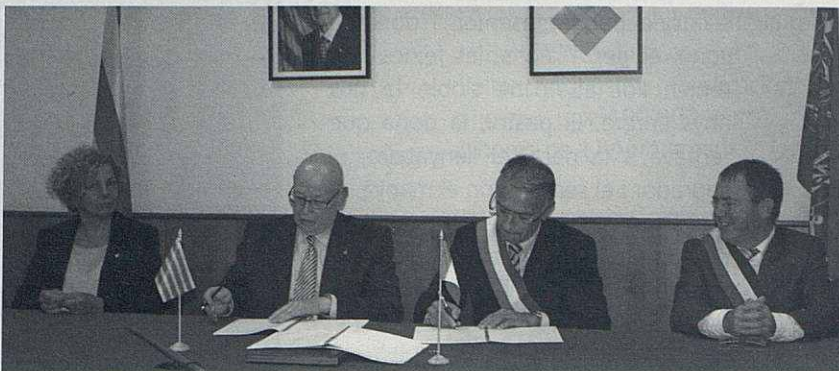
Acte de signatura de l'agermanament amb Montville.

Quan a realitzacions, destaca la instal·lació del clavegueram a les cases del Lluiset i l'arranjament de la Font d'Abril que comporta el condicionament de la zona amb la creació d'espais verds i una via peatonal d'uns tres quilòmetres.