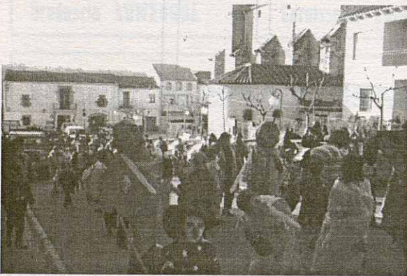
La rua durant el seu camí cap a la Plaça Sant Jordi

El passat dissabte 8 de febrer a la Roca es va celebrar el Carnestoltes.