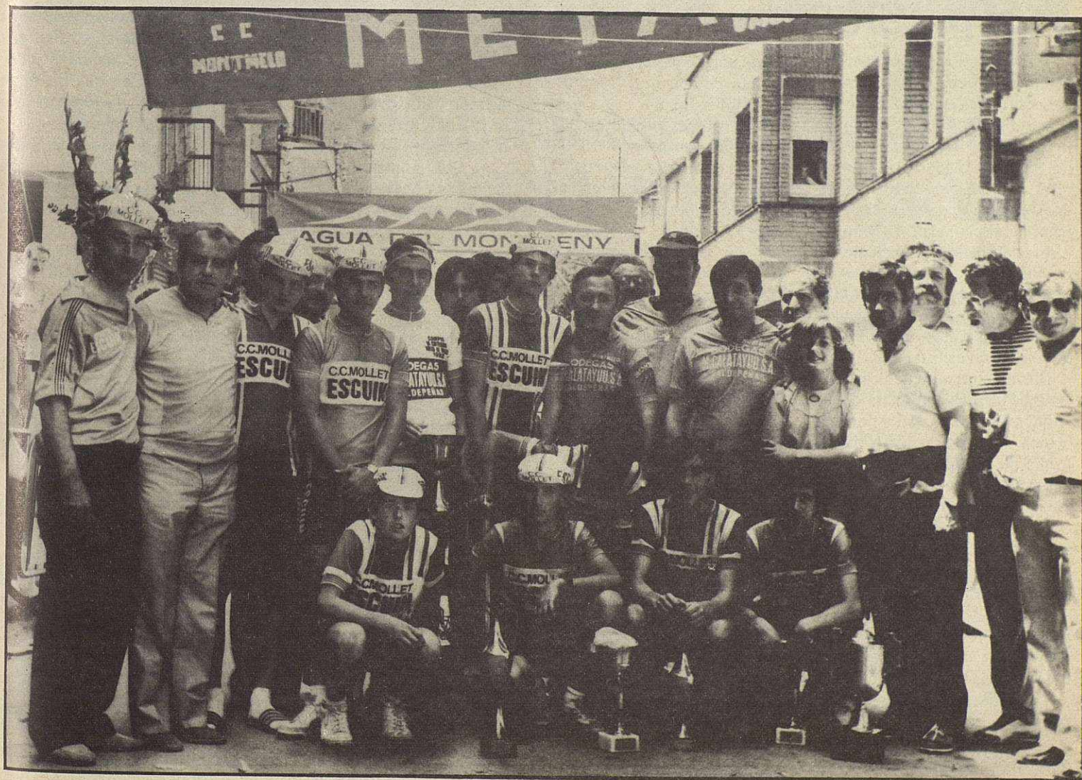
Los corredores del C.C. Mollet-Escuin, que fueron al copo de trofeo y que quedaron primeros por equipos, posan con tecnicos del club y organizadores de la prueba al finalizar la misma.