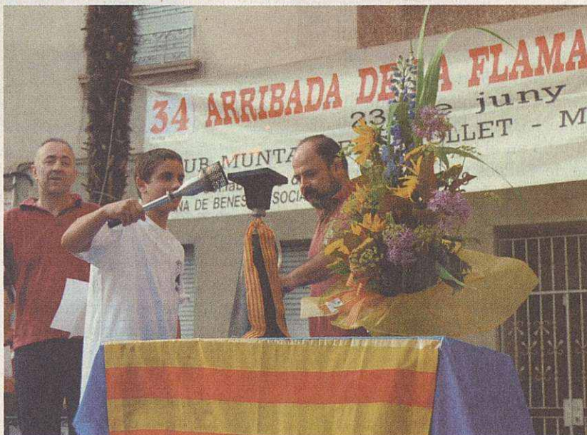
Momento de la llegada del la Flama del Canigó

Destaca también la 1ª Mostra de d'art Nou@rt al carrer, a cargo de jóvenes artistas que se celebró el pasado 28 de junio en la plaza