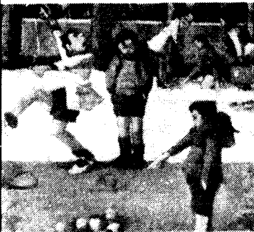
Pintura d'Amador Garrell