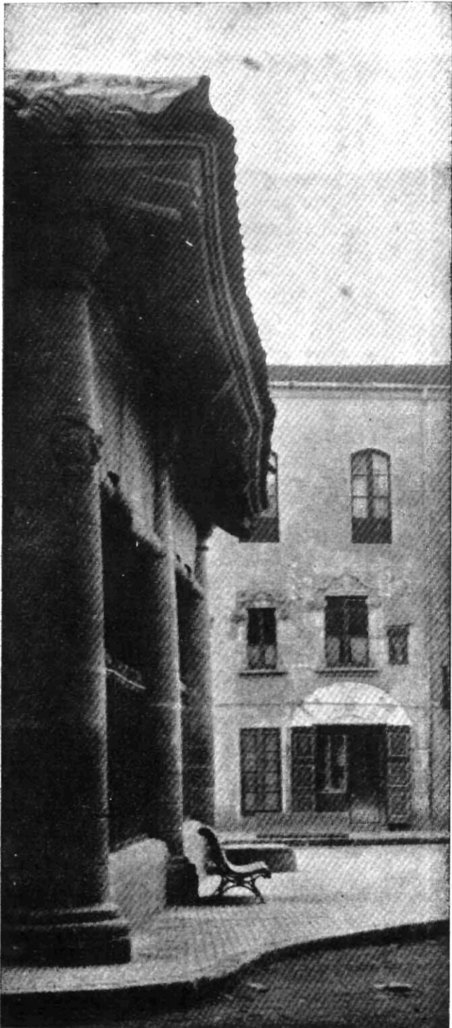
Això, que sembla l'atri d'un vell palau, és la Porxada.