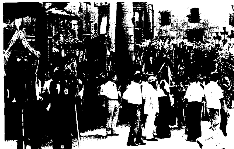
Els Estendards Claverians, a la Porxada