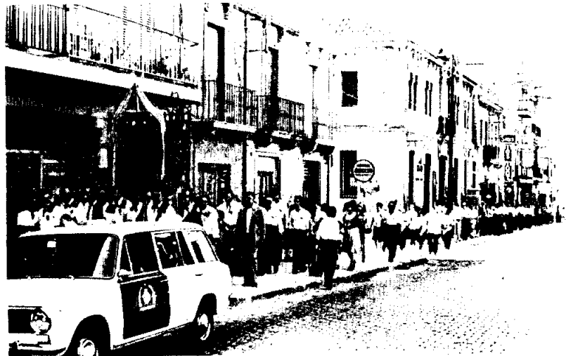
Desfilada de les Corals