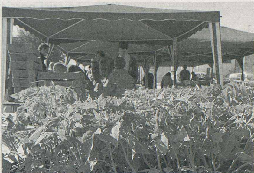
Una mostra de les 12.000 tomaqueres que es van vendre a la fira "Lliga't a la Terra".

No podem pas detallar totes les activitats i iniciatives que es realitzen als nostres centres docents amb l'objectiu de millorar la formació dels nostres infants i joves. Només podem deixar constància que són moltes i variades de les quals cal felicitar als, a les, nostres docents.