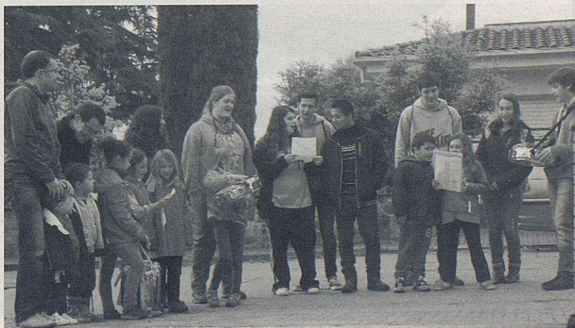
El grup que va recórrer el poble cantant les Caramelles.

Dilluns de Pasqua es va despertar amb un plugim empipador, especialment pels esplaiers que, com cada