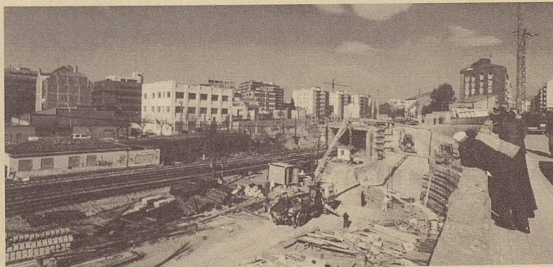
Ampliació del pont de la carretera de Mataró