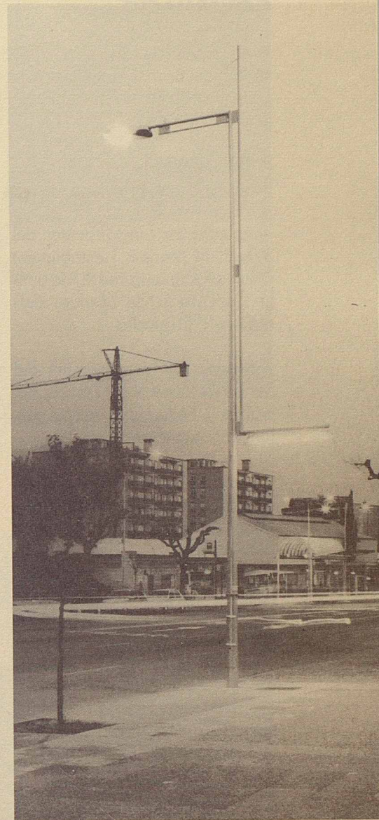
Implantació del control centralitzat de l'enllumenat públic