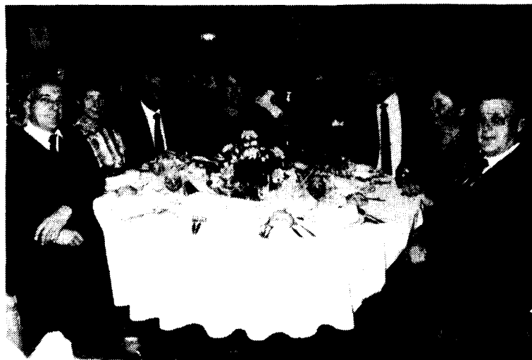
Un aspecte del sopar