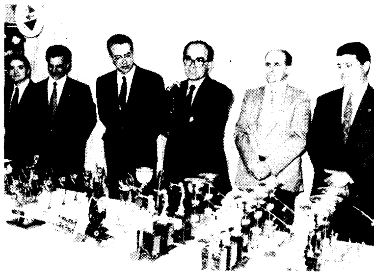
Lliurament de guardons.- Presidència

Acompanyaven els directius de l'entitat l'alcalde de Granollers, el regidor d'esports, el Director General d'Esports de la Generalitat de Catalunya i el president de la Federació Catalana de Pesca, que palesà la importància del club granollerí sobretot en la modalitat de càsting, essent-ne esportistes de la societat el grup més important de la selecció nacional de càsting.