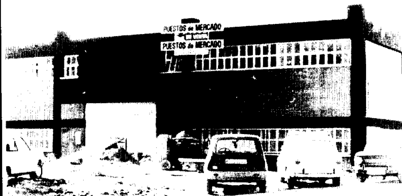
Vista de las instalaciones del mercado de la alimentación