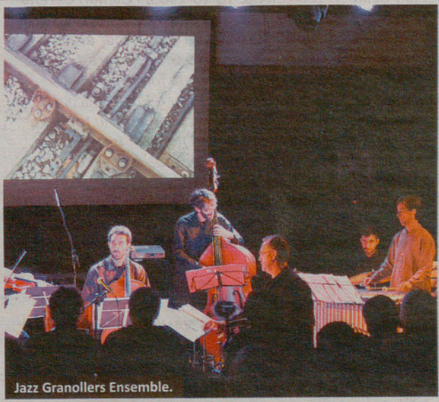
Jazz Granollers Ensemble.