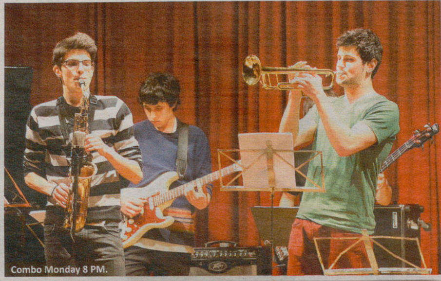
Combo Monday 8 PM.

CONCERT Granollers Swing Five tancarà aquesta setmana el certamen amb una vetllada d'allò més festiva