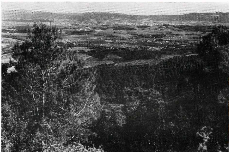
Panoràmica de El Rieral y Granollers, desde el Castell de Montbui