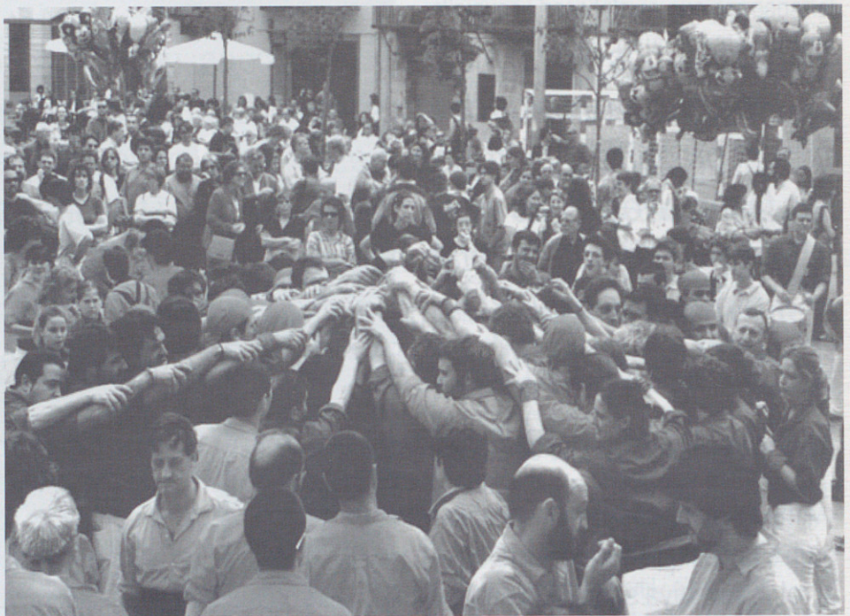
Pinya de la torre de set a punt per travar els segons.

Els anys passen i els Xics continuem la nostra línia de creixement. El tres de vuit marca un salt cap a castells d'una altre dimensió. Quan vàrem arribar a aquest nou sostre l'any passat, tots erem conscients de que caldria temps, treball i molta il·lússió per superar-nos i arribar a assolir nous reptes. Per molts consolidar aquest nivell ja és un repte prou important. Ara un cop acabada aquesta primera part de la temporada podem dir que hem arribat amb tranquil·litat a aquest nivell (només portem una llenya, i de pilar, i cap castell desmuntat). És hora de continuar treballant amb molta il·lússió i aprofitar el temps per arrodonir els bons resultats obtinguts fins ara, on cal destacar per sobre de tot els sis castells de vuit descarregats. Ens veiem a l'assaig. Aquestes han estat les primeres actuacions de la temporada 99: