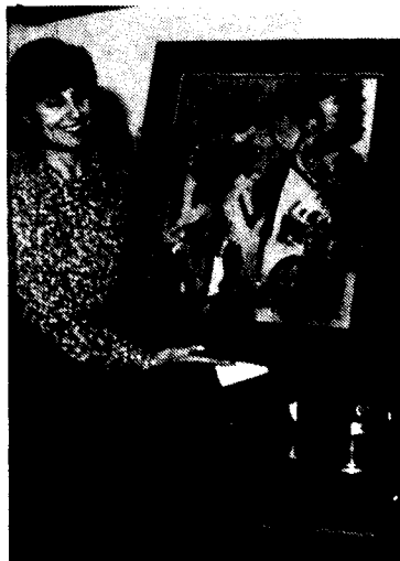
Afavorida amb la pintura obsequi d'Espai B/M

A cada taula la pregunta era gairebé la mateixa. Qui guanya-