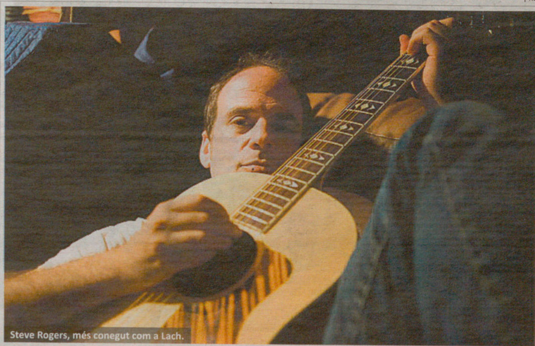
Steve Rogers, més conegut com a Lach.

El cantautor nord-americà, figura de culte de la música independent i pioner del moviment antifolk, actuarà aquest dissabte a l'Anònims