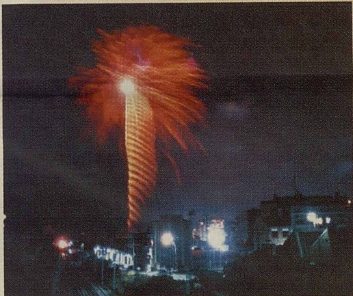
"Estirada de la corda" per: El Asqueroso Perico Grima

No oblideu, doncs que, per tancar la Festa Major 2004, el diumenge 29 a les 22.30 h al Parc Firal, podreu gaudir del Castell de Focs d'artifici a càrrec de Pirotècnia Turis.